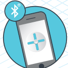
Ovládání pomocí Smartphonu