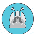
Přístup k filtrům z vrchu